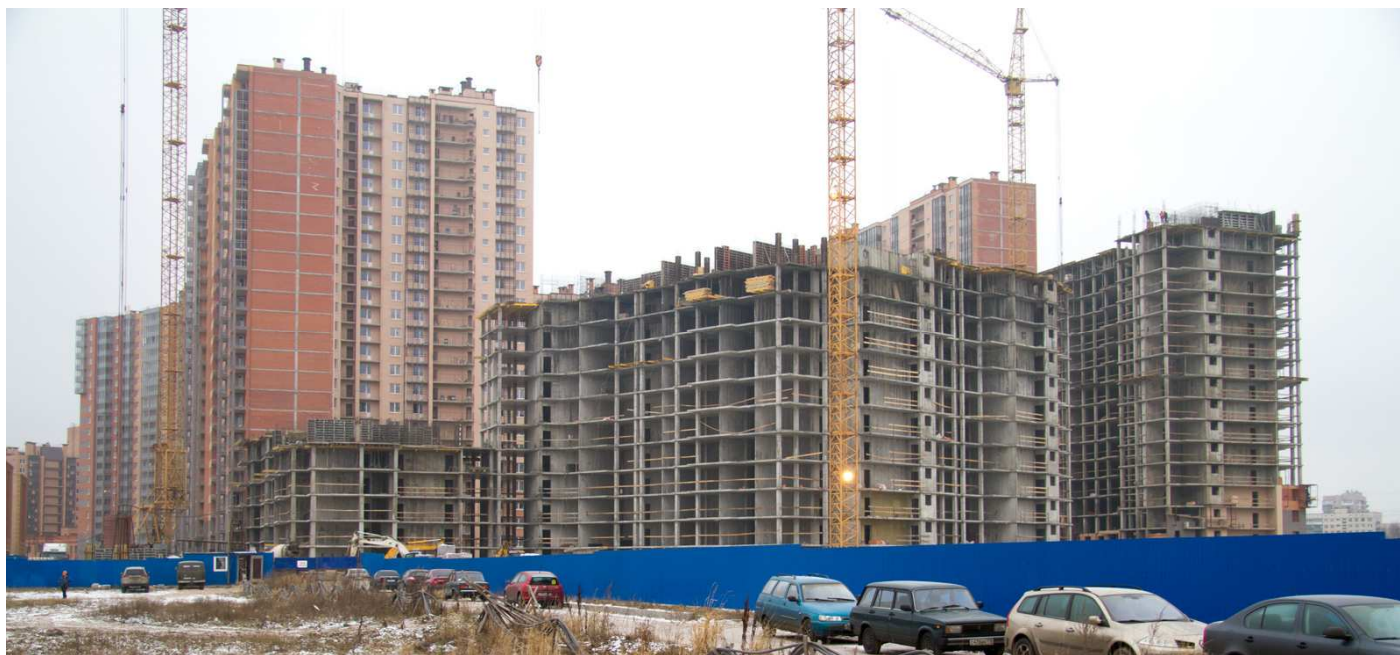
Вид со стороны Областной ул., секции 6-4, 35-34, 30-26, 25-22, 16-17, 18-19