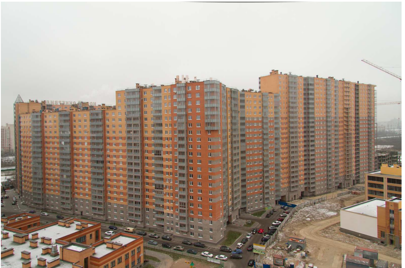
Вид со стороны детского сада на секции 12-4, 35-29