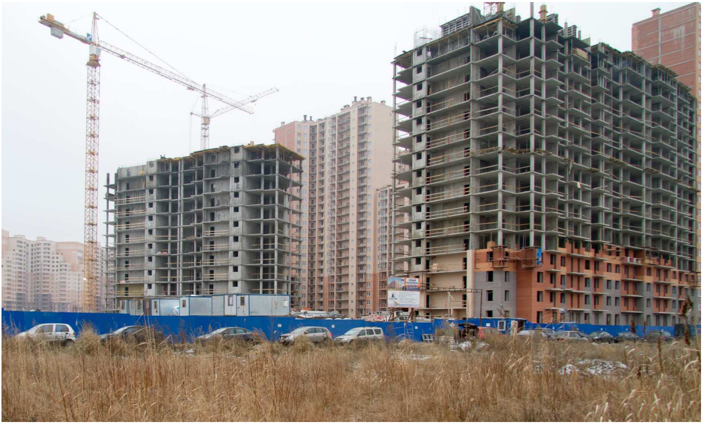
Вид с Областной ул. на секции 21, 19-18