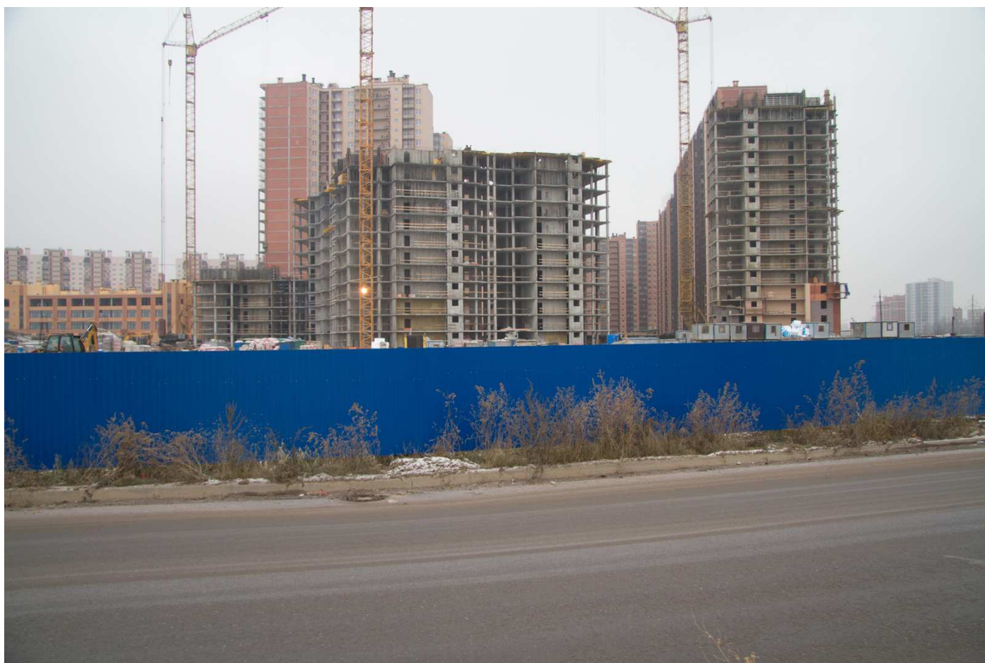
Вид с Областной ул. на секции 25-22, 18-19