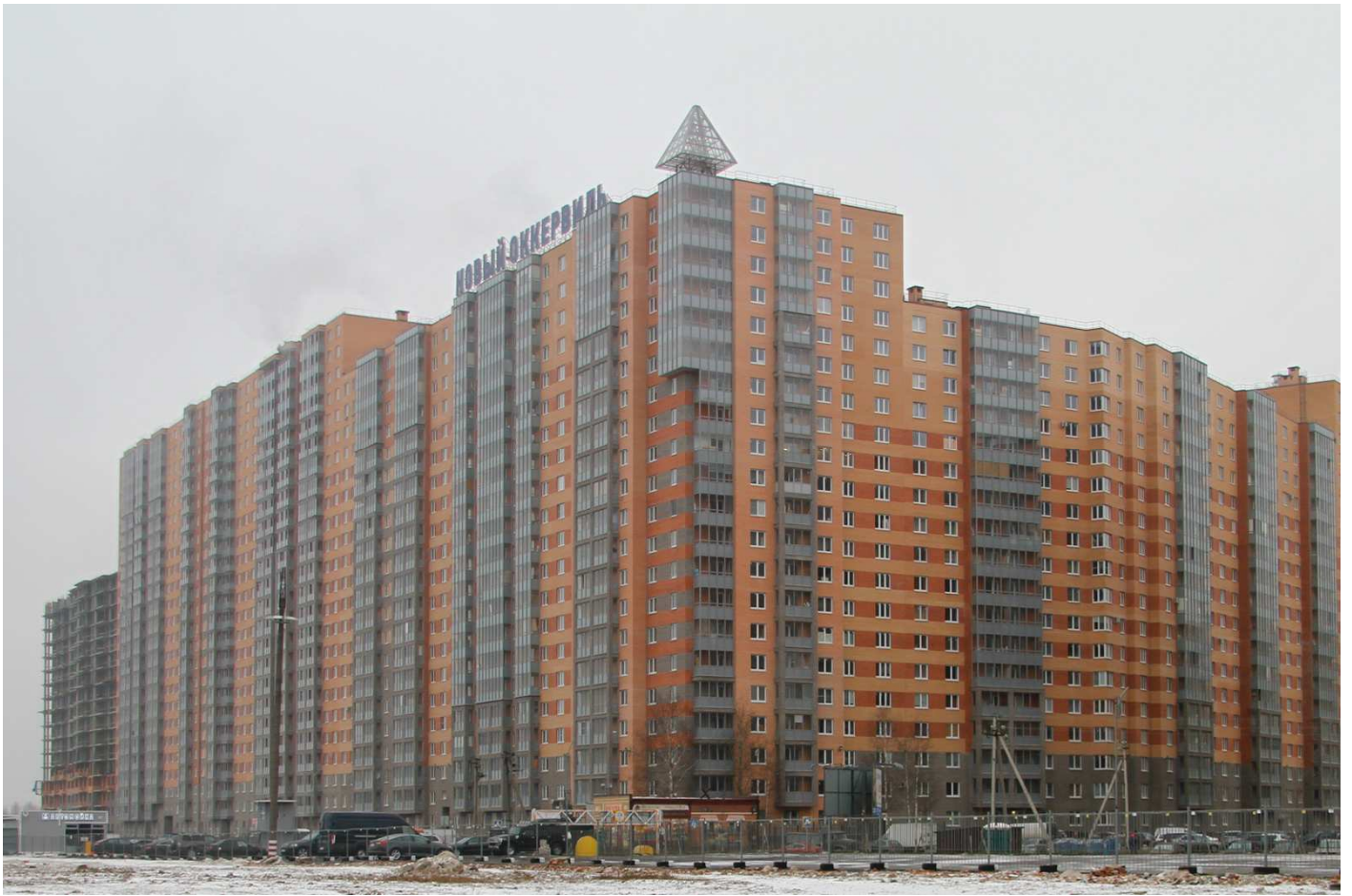
Вид с Областной улицы на секции (слева направо) 17-7